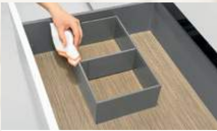
AMBIA-LINE für Frontauszüge, Stahldesign