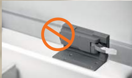
SERVO-DRIVE, die elektrische Bewegungsunterstützung