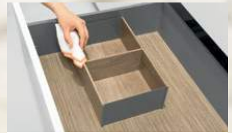
AMBIA-LINE für Frontauszüge, Holzdesign